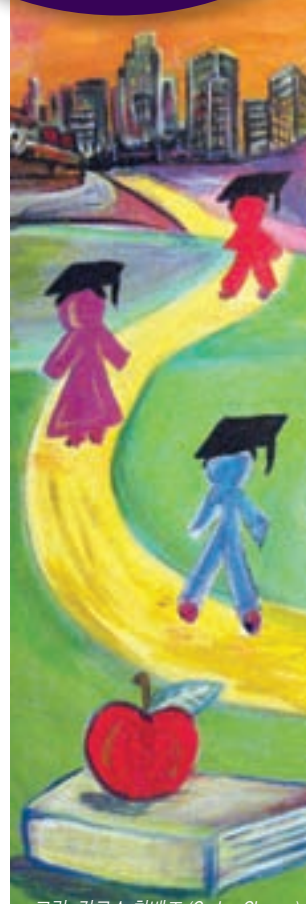
그림: 칼로스 차베즈 (Carlos Chavez) 디자인: 로빈 하트 (Robyn Hart) 번역: PALS for Health

우리는 엘에이 지역 가정을 후원하고, 가정이 어린 자녀들의 우수한 보육 및 교육 프로그램을 모색하는 과정에서 당면하는 여러 문제 해결을 도와야 할 것입니다.